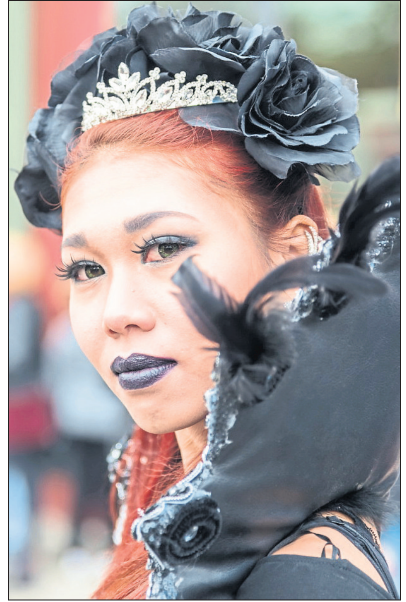
Ebenfalls von Dirk Gieselmann aus Bad Oeynhausen stammt diese Portraitaufnahme auf einer Festivalveranstaltung.