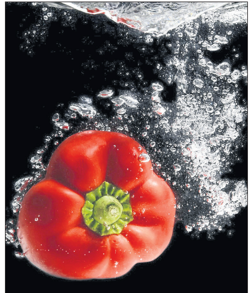
Mit einer besonderen Aufnahmetechnik, die besonderes Equipment verlangt, hat Erhard Sander diese Paprika im Bild festgehalten.