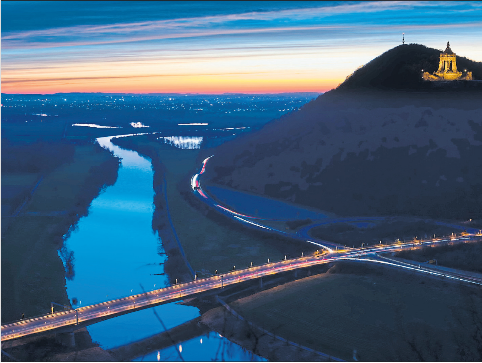
Dirk Gieselmann steuert zur Ausstellung in der Volkshochschule dieses Foto vom Kaiser-Wilhelm-Denkmal an der Porta Westfalica bei.